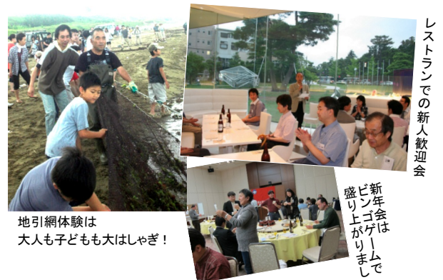
地引網体験は大人も子どもも大はしゃぎ!