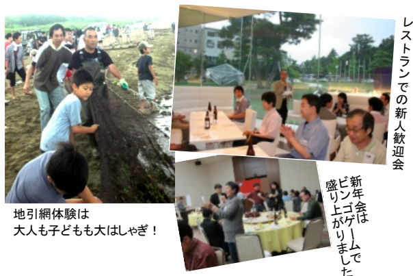
地引網体験は大人も子ども大はしゃぎ!