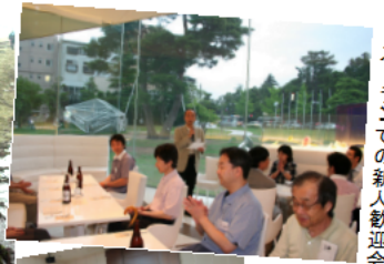
レストランでの新人歓迎会