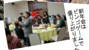
新年会はビンゴゲームで盛り上がりました