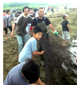
地引網体験は大人も子どもも大はしゃぎ！

また女性部では、絵手紙の会や、クリスマスリース作り、エコバッグ作り、ひな人形作り等のハンドメイド、女性や非常勤職員の労働に関する学習会を実施しています。