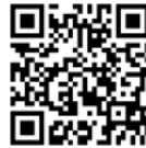
金沢大学教職員組合の組合費（月額）